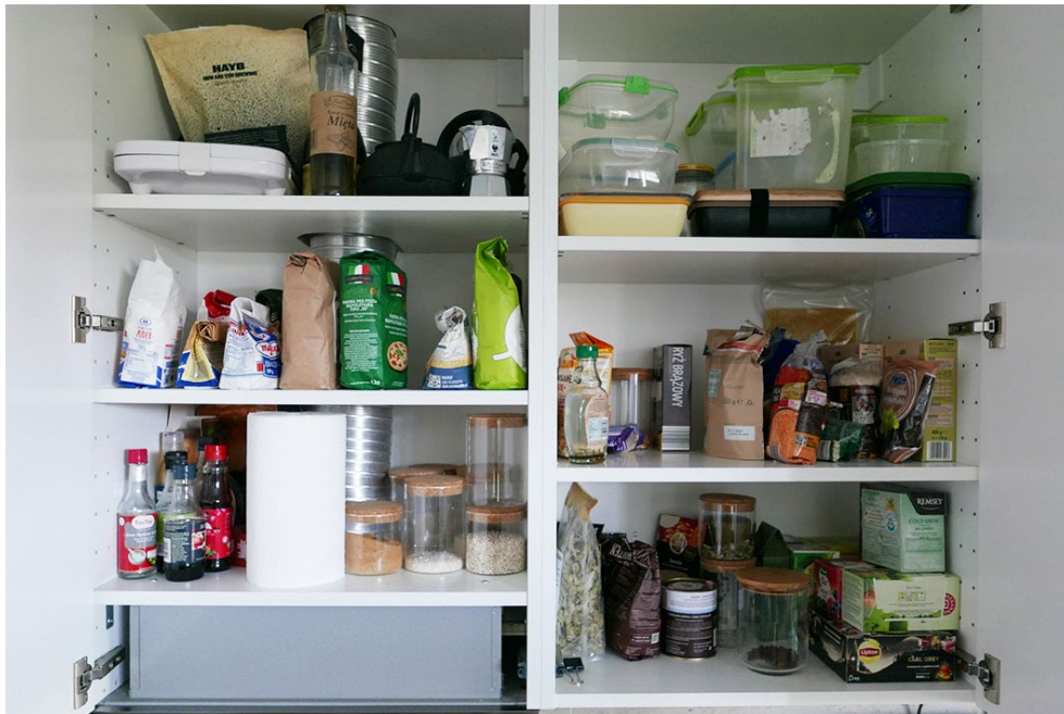
Fot. 2. Ustalony układ składników i sprzętów w jednej z szafek kuchennych, w którym „odnajdujemy się” oboje

np. w sprawczości w naprawianiu sprzętów, w zdolnościach w grach strategicznych (skoncentrowanie na celu u mężczyzn), w dbałości o porządek, w rozumieniu potrzeb (systematyka i opieka u kobiet). Być może jest to uproszczenie, bo jak wiemy, każda jednostka realizuje się na swój sposób... A sama czuję się wyjątkiem od tej reguły jako hobbystka stolarstwa i wielbicielka ręcznych narzędzi japońskiego pochodzenia.