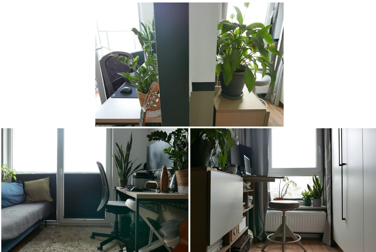
Fot. 1. Granica przestrzenna pomiędzy stanowiskami pracy w postaci ściany (na górze), stanowisko w pokoju dziennym (na dole po lewej), stanowisko w sypialni (na dole po prawej)

Granica jest umowna (a może i podświadoma) i płynna, i można ją przekraczać (z wyczuciem). Zarówno ja jak i K. korzystamy z obu pomieszczeń i nie mamy związanych z tym większych ograniczeń. Istnieje jedynie pewne poczucie prywatności tych stanowisk – ja nie ingeruję w biurko K. (drogocenne sprzęty, nie potrafię korzystać z jego klawiatury do komputera), on natomiast nie ingeruje w mój „neseser” – biurko-komodę, mój sejf i prywatny układ rzeczy. Zatem można przypuszczać, że granica którą zbudowaliśmy, wiąże się z potrzebą prywatności, której nie uświadomiliśmy sobie do końca na początku, a która wyraziła się poprzez ten podział w przestrzeni mieszkania.