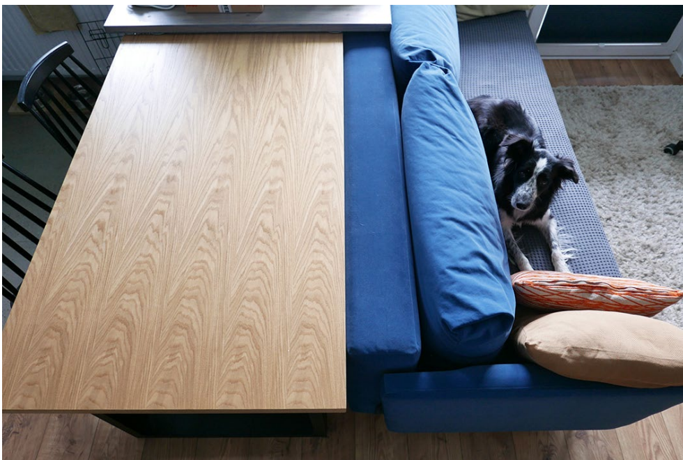
Fot. 5. „Strefa 0”

przestrzeni miał pies! Nasza sunia, będąc niedawno jeszcze szczeniakiem, miała tendencję do gryzienia wszystkiego (wszystkiego!) w swoim zasięgu, co wiązało się także z wizytami na stole pod naszą nieobecność. Od małego nauczyliśmy ją zostawiania samodzielnie w domu na jakiś czas. Podczas tych lekcji nauczyliśmy się usuwania wszelkich przedmiotów ze stołu, z sofy, chowania obuwia oraz zasłaniania wtyczek w ścianie i naroży mebli. Przy każdym wyjściu z domu, kiedy pies miał zostać sam, podwójnie upewnialiśmy się czy nic nie zostało na pastwę jego zębów. Można w końcu powiedzieć, że my tresując ją, zostaliśmy również wytresowani. A „strefa 0” służy nam obojgu w równym stopniu, bez żadnych podziałów.