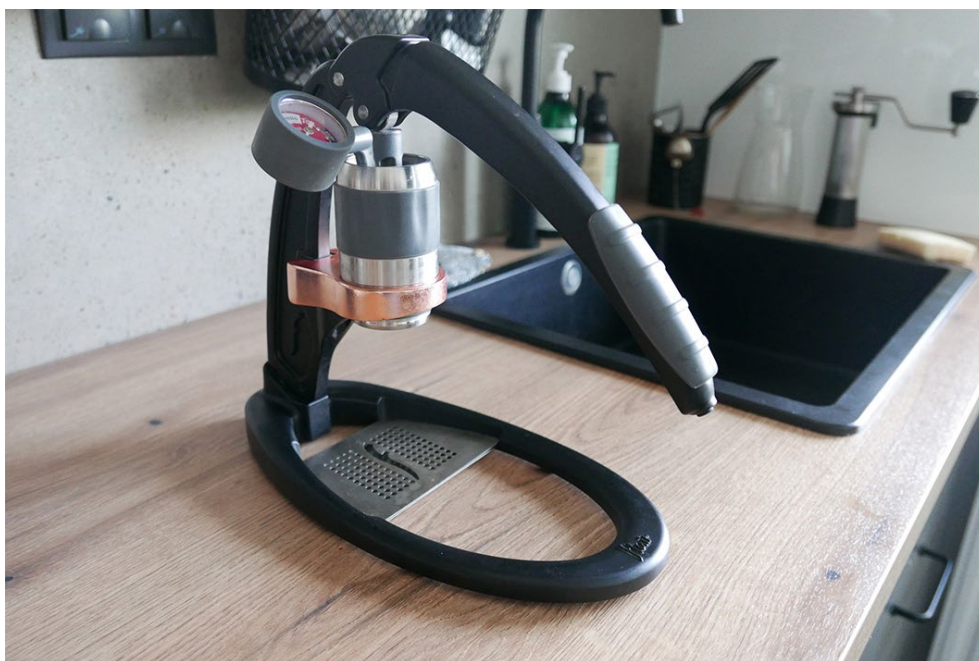
Fot. 3. Wajcha do parzenia kawy espresso