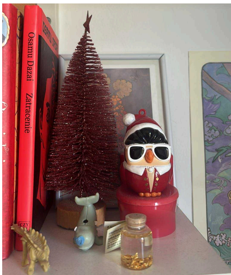
Fot. 6 Figurka pingwina , źródło własne

Kolekcjonowanie samo w sobie stanowi bardzo szczególny rodzaj fetyszu, który najlepiej chyba rozumieć jako próbę cofnięcia upływającego czasu 10 . To słowa Deyan Sudjic, który twierdzi, że przedmioty są sposobem na odmierzanie upływu naszego życia. Przyglądając się mojemu mieszkaniu, zauważyłam, że jest ono zbiorem wszelkich rodzajów pamięci, zarówno indywidualnej, jak i grupowej. Tożsamość, którą nasze domostwa obrazują, tkwi we wspomnieniach, które widać nie tylko w zabrudzonych ścianach, ale również w przedmiotach ustawionych w różnych kątach. W moim mieszkaniu nawet przedmioty pozornie błahe nabierają znaczenia dzięki historii, którą w sobie niosą. Mimo, że określam je, jako kiczowate, nie uważam, że są brzydkie, czy też, że powinny zostać wyrzucone. Przedmioty te tworzą sieć powiązań między przeszłością, a teraźniejszością, pozwalając odczytać życie domowników, ich przyjaciół, czy bliskich. Kicz, to zjawisko, które jest wyrażeniem bardzo subiektywnym 11 , dlatego klasyfikacja przedmiotów pod względem „kiczowate czy nie?” skupia się na wartościach estetycznych.