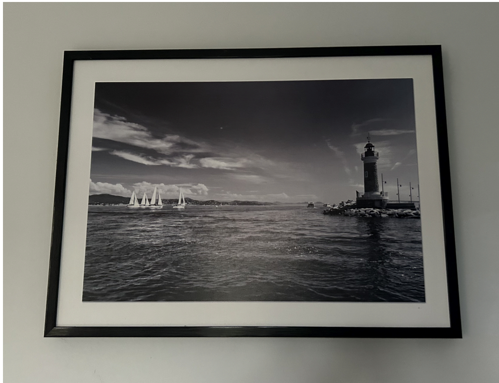
Fot. 2 Krajobraz

Widoki takie jak zachód słońca, czy zielona, kwiecista łąka to nieoryginalny, powszechny sposób przedstawienia natury. Tego typu obrazy mają na celu przedstawić mało złożone piękno, które nie wymaga głębszej interpretacji. Dają one poczucie satysfakcji estetycznej, mimo tego, że nie niosą za sobą głębszej wartości artystycznej, a ponadto, z racji na swój niski stopień oryginalności, czy też niepowtarzalności, są one w cenach przystępnych przedstawicielom klas niższych.