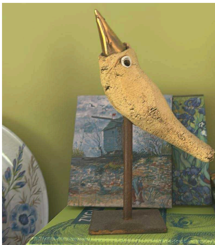
Fot. 5 Figurka ptaka