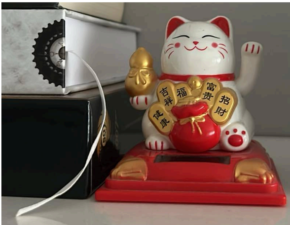
Fot. 3 Maneki-neko

Analizując obecność kiczu w mojej przestrzeni domowej, stwierdziłam, że wiele z wyżej opisanych masowo produkowanych i estetycznie wątpliwych przedmiotów, ma w moim odczuciu wyjątkowe znaczenie, ze względu na ich historię. Igor Kopytoff, jasno podkreśla fakt, że rzeczy, tak jak ludzie, posiadają swoje biografie, a pytania, które stawiamy pracując nad nią, nie różnią się wiele od tych, jakie stawiamy pytając o ludzi 9 . W tym kontekście, pocztówki (fot. 4), figurki (fot. 5) czy inne tego typu pamiątki, posiadają ogromną wartość symboliczną. Jako nośniki pamięci nie można oceniać ich jedynie pod względem estetyki czy wartości ekonomicznej, ponieważ ich znaczenie wywodzi się z innej narracji, którą ze sobą niosą. Nawet pozornie kiczowate ozdoby, ustawione na półkach czy komodach, nabierają indywidualnego charakteru, stając się świadkami życia domowników, przypominając o drobnych radościach, podróżach czy ważnych wydarzeniach. W ten sposób przestrzeń mieszkalna przestaje być jedynie zbiorem przedmiotów użytkowych, a granica między dekoracją, a symboliką się zaciera. Przechowywanie ich to sposób na podtrzymanie pamięci, dbanie o dziedzictwo oraz więzi, a tym samym tworzenie osobistego charakteru mieszkania, który nadaje mu unikalną atmosferę.