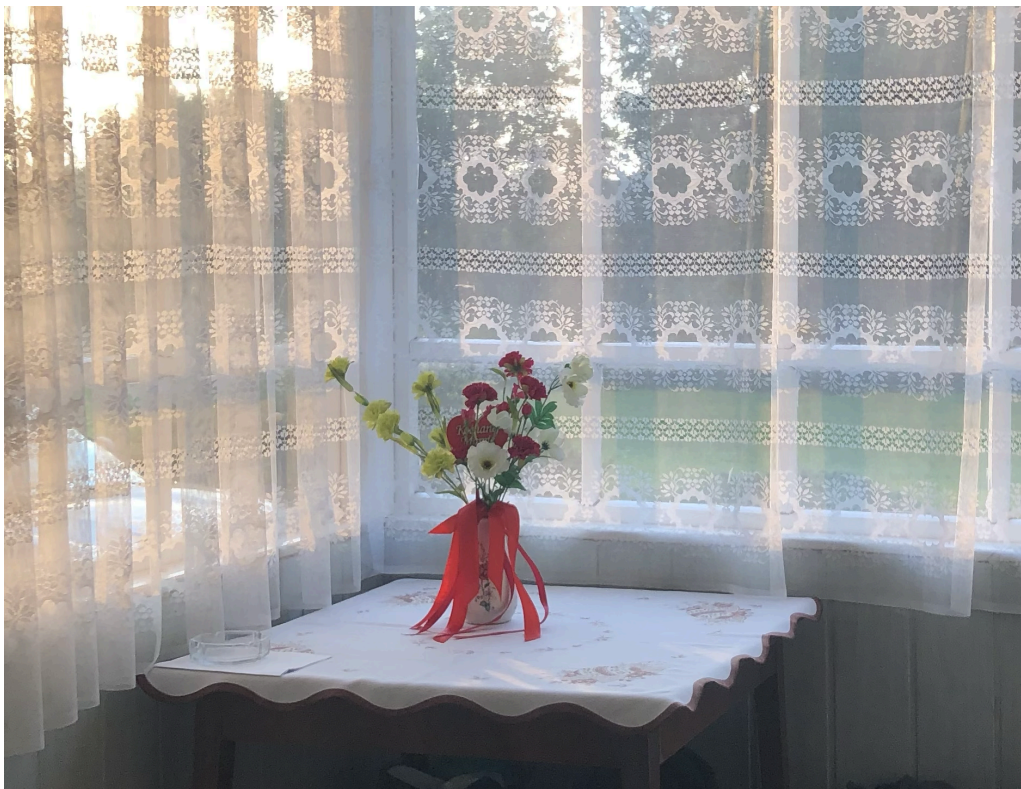
Fot 1. Sztuczne kwiaty

nie tylko wyborem estetycznym, lecz także symboliczną próbą podniesienia swojej pozycji społecznej poprzez naśladowanie wzorców wyższych klas. Przedmioty i formy uznawane za kiczowate, od imitacji drogich materiałów po przesadne dekoracje, pełnią funkcję zarówno emocjonalną, jak i społeczną, ponieważ dają poczucie prestiżu, nawet jeśli w rzeczywistości dostęp do niego jest ograniczony. Przykładem takiej imitacji są np. sztuczne kwiaty (fot. 1), zastępujące świeże, droższe i wymagające częstej wymiany bukiety z kwiaciarni. Ich jaskrawe i krzykliwe barwy wpisują się w definicję przesady, a tym samym sprawia, że są one kiczowatą dekoracją.