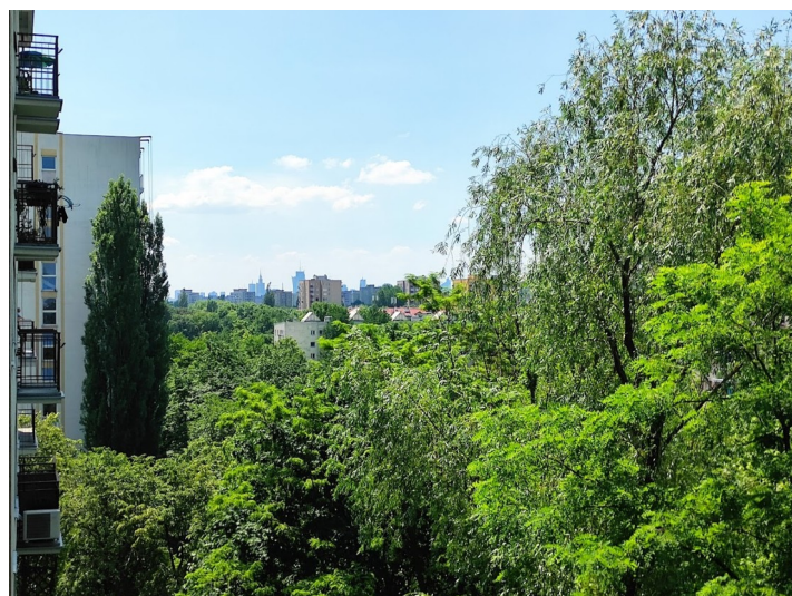
Zdjęcie 7: Widok z mojego balkonu w stronę centrum

Ważnym elementem domowości jest według mnie sposób przyjmowania gości. Tak jak wcześniej wspominałem najczęściej przestrzenią w jakiej spędzamy czas z naszymi gośćmi