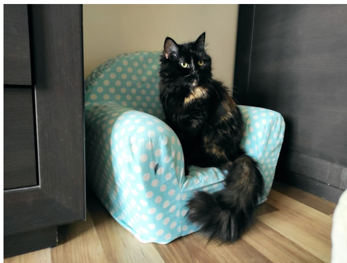
Zdjęcie 10: Kotka Gerda siedząca na swoim fotelu

Ważnym elementem, którego nie mógłbym pominąć pisząc o moim mieszkaniu jest połowa jego mieszkańców, którą stanowią koty. Jak wcześniej wspominałem mieszka z nami kotka Gerda, którą adoptowaliśmy w maju 2019 roku oraz kot Tadeusz, którego adoptowaliśmy w styczniu 2020.