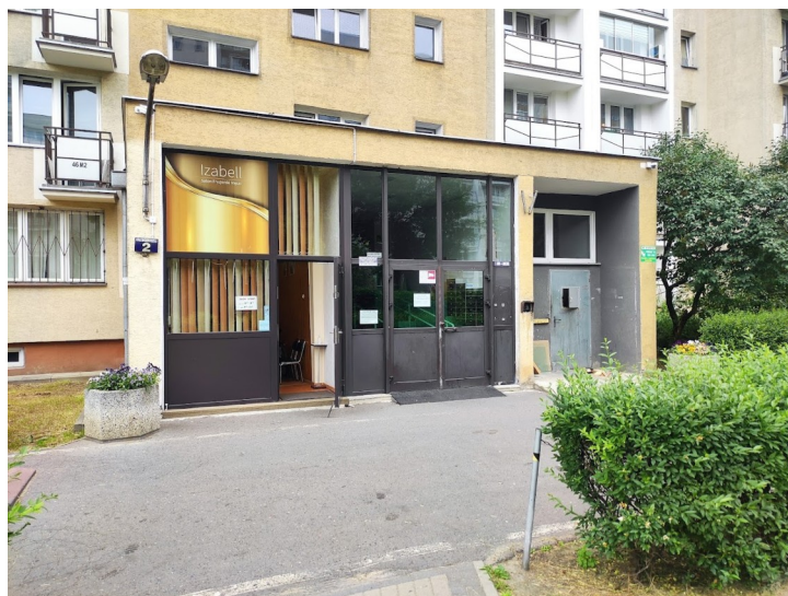
Zdjęcie 2: Fryzjer znajdujący się w jednej z zaadaptowanych przestrzeni na moim osiedlu

Moje osiedle wywołuje we mnie skojarzenia z ideą Formy Otwartej Oskara Hansena. Forma otwarta zakłada takie projektowanie budynków i przestrzeni, które będzie pozwalało na zmienianie go w zależności od tego na jakie użytkowanie będzie zapotrzebowanie w danym czasie. Podobnie dzieje się na moim osiedlu – dzięki dużym przestrzeniom między blokami jest miejsce aby powstawały place zabaw, siłownie plenerowe czy boiska. Ciekawym zjawiskiem jest również powstawanie małych sklepów i punktów usługowych w zaadaptowanych przestrzeniach będących częścią wejść do bloków.