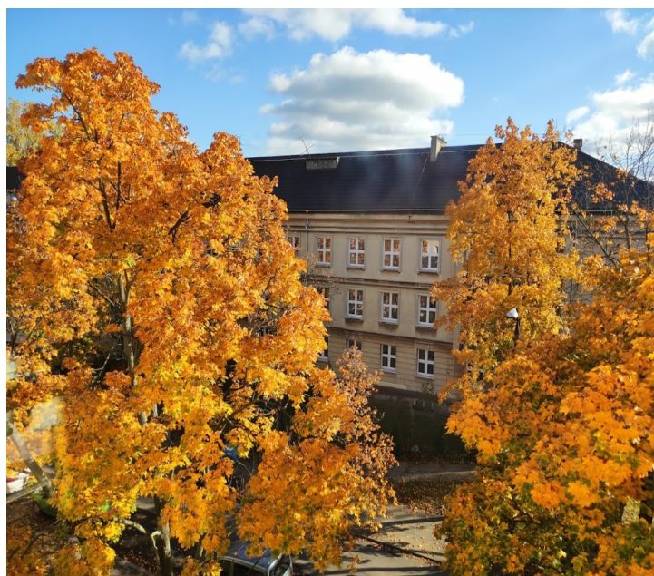
Zdjęcie 1: Jesień 2020, widok z okna mojego poprzedniego mieszkania

O ile nie poczułem się nigdy związany z Włochami to zdążyłem zadomowić się na Grochowie i rozstanie z nim było dla mnie smutnym momentem. Motywacją do zmiany miejsca zamieszkania był jednak standard grochowskiej kawalerki, która była zaniedbanym mieszkaniem, nieremontowanym od lat 90, co coraz częściej dawało nam się we znaki. Postanowiliśmy znaleźć coś w lepszym standardzie i wybór padł właśnie na Bródno. Początkowo byłem pewien obaw wobec tego ile będą zajmowały dojazdy z tej części miasta na uczelnię i do pracy, jak również co do tego czy otoczenie mojego nowego mieszkania będzie równie przyjemnym miejscem do życia co poprzedniego.