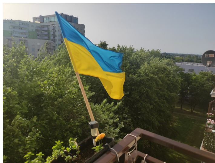
Zdjęcie 8: Ukraińska flaga na moim balkonie