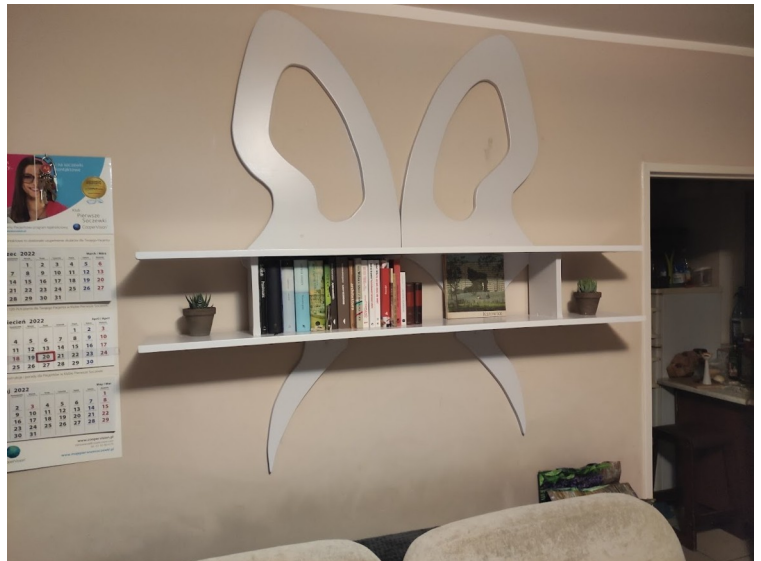
Zdjęcie 5: Półka w kształcie motyla wisząca nad naszą kanapą

W tym miejscu chciałbym powrócić na chwilę do jednego z najważniejszych miejsc w moim domu. Tym miejscem jest balkon. Mimo jego bardzo małych rozmiarów (jego powierzchnia to mniej więcej metr kwadratowy) jest on dla mnie o tyle specjalny, że w żadnym z poprzednich pięciu mieszkań, w których zdarzyło mi się mieszkać tylko w jednym znajdował się balkon (służył on tam wyłącznie do palenia papierosów), ale w żadnym nie miałem możliwości urządzić go wedle moich