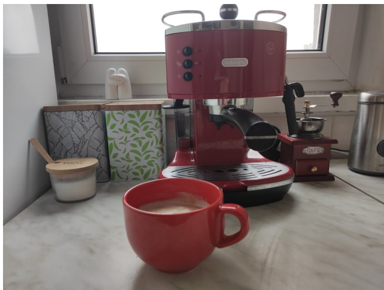
Zdjęcie 9: Blat w mojej kuchni zajęty w dużej części przez ekspres do kawy

Gdy są to osoby, które rzadko u nas bywają, zazwyczaj są one sadzane w jednym miejscu, a my jako gospodarze przygotowujemy napoje, posiłki i przynosimy je naszym gościom. Jeśli ktoś bywa u nas częściej atmosfera staje się dużo bardziej swobodna. Nasi stali goście wiedzą gdzie znajdują się rzeczy w naszym mieszkaniu i w dużej mierze obsługują się samodzielnie, a czasami nawet goście przygotowują coś dla domowników. Istnieje również różnica w planowaniu aktywności podczas wizyt.