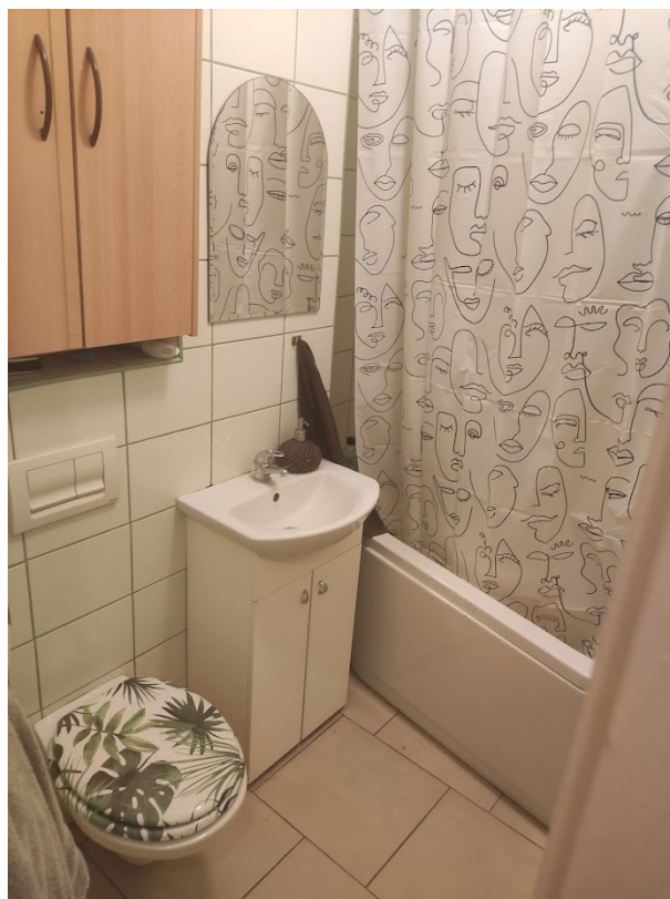
Zdjęcie 4: Nasza łazienka

W swojej głowie oddzielam dwie części głównego pokoju przez pryzmat stojących w różnych miejscach sprzętów elektronicznych. Pierwszym z tych dwóch sprzętów jest komputer stojący na biurku we wnęce dzięki czemu kiedy przy nim siedzę czuję się oddzielony od reszty pokoju dzięki byciu częściowo zastoniętym przez ścianę znajdującą się po mojej prawej oraz dzięki temu, że reszta domu znajduje się za moimi plecami co pozwala mi na lepsze skupienie na tym co akurat robię. Ta część mieszkania jest dla mnie miejscem, w którym najczęściej się uczę, wypełniam raporty i wykonuję inne czynności związane z pracą oraz rzadziej gram w gry.