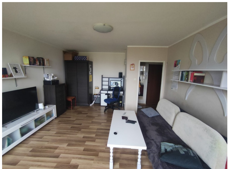
Zdjęcie 6: Ogólny widok na pokój główny, w głębi widoczna wnęka, w której znajduje się biurko